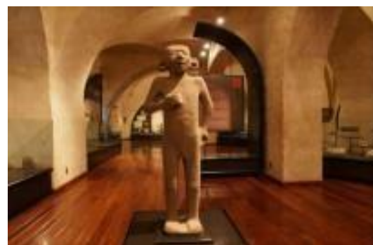
Adolescente Huasteco, Museo Histórico de la Sierra gorda.