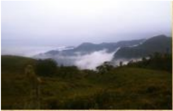
Autor María Natividad Galindo Castro

especies maderables de relevancia económica, acompañadas de especies empleadas con fines forrajeros y leñosas. Estos manchones de selva se entremezclan con cafetales y, de manera creciente, con espacios pecuarios. (Programa de Desarrollo Cultural de la Huasteca).