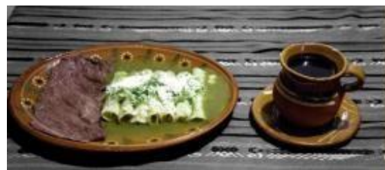
Huauchinango Pueblo Mágico | Facebook